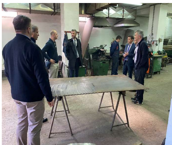
Foto: Premijer KS i resorni ministar tokom obilaska radnika Službe servisa

U nastavku posjete u okviru radnog sastanka čelnika Vlade KS i nove Uprave Toplana, fokus je stavljen na spomenute projekte koje Toplance Sarajevo namjeravaju realizovati tokom 2020. godine, a odnose se na potpunu rekonstrukciju kotlovsog postrojenja „Kampus“, potpuno nova kotlovnica na području Općine Vogošća, pojačane aktivnosti na naplati potraživanja i intezivirane aktivnosti na ugradnji mjerila utroška toplotne energije kao jedan od preuslova za povećanje energijske efikasnosti, te uvođenje novih tehnologija sa ciljem jačanja efikasnosti i održivosti sistema.